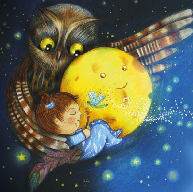
Illustration Marie-Pierre Emorine

De et Par Claudia Mad'moiZèle www.claudia-madmoizele-conteuse.fr